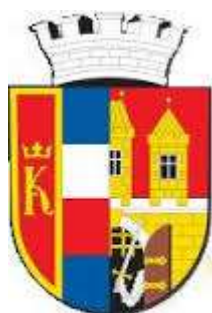
MČ Praha 8